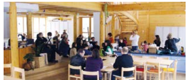
Das geräumige Foyer für Seminare, Tagungen und Feiern