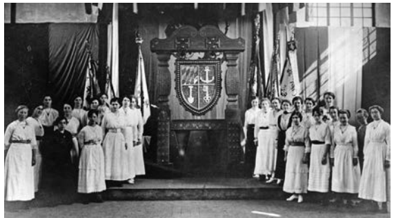
Ehrendamen bei der Aufstellung des Nagel-Wappens, 1914-1918