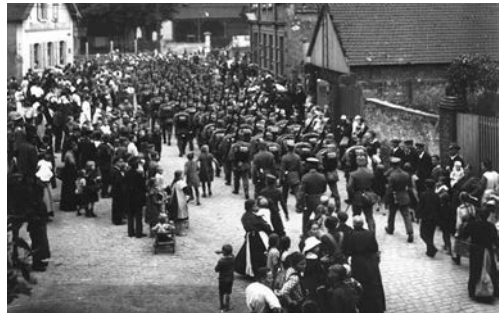
Auszug der Rekruten, Mundenheim am 17. März 1915