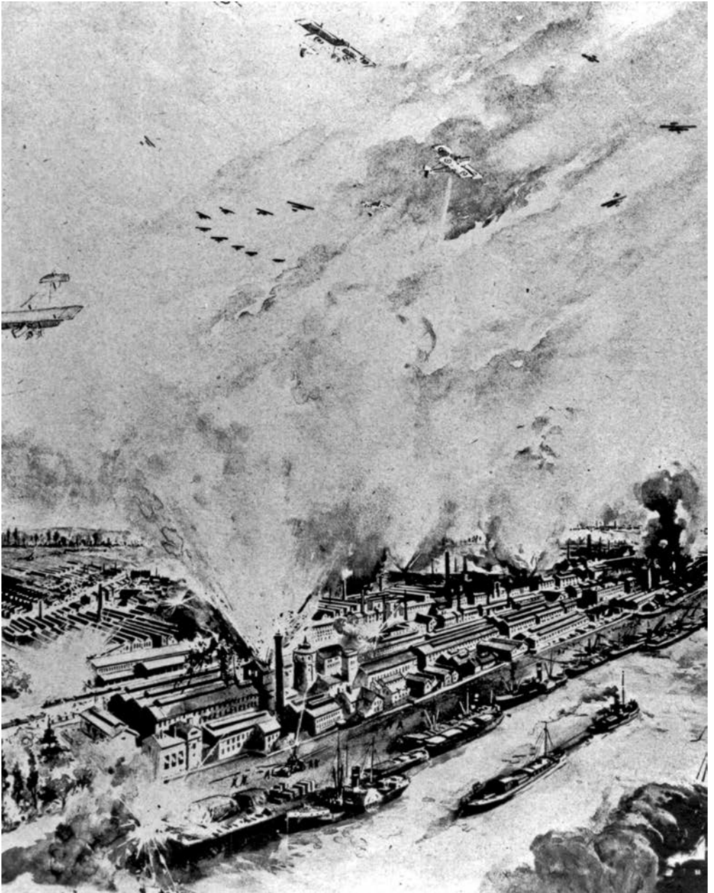
Erster Luftangriff auf Ludwigshafen, französische Bomben fallen auf die BASF, 27. Mai 1915