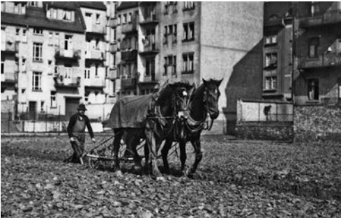
Anlagen in der Stadt werden zum Anbau von Gemüse und Kartoffeln gepflügt, 1914-1918