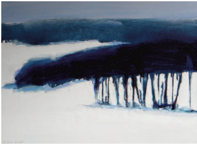
Rodolphe Le Corre, Lorient