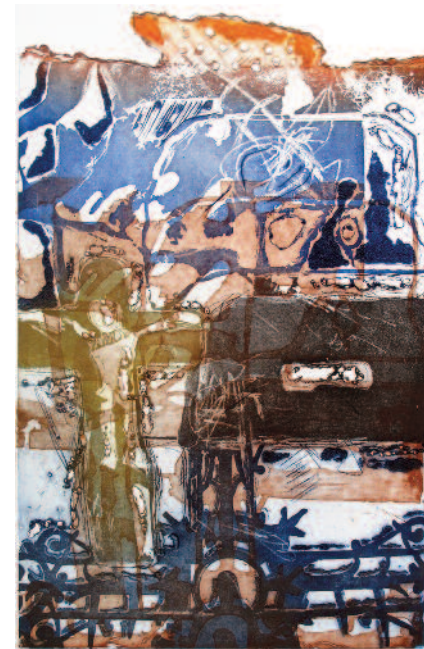
Günther Berlejung, Fußgönheim