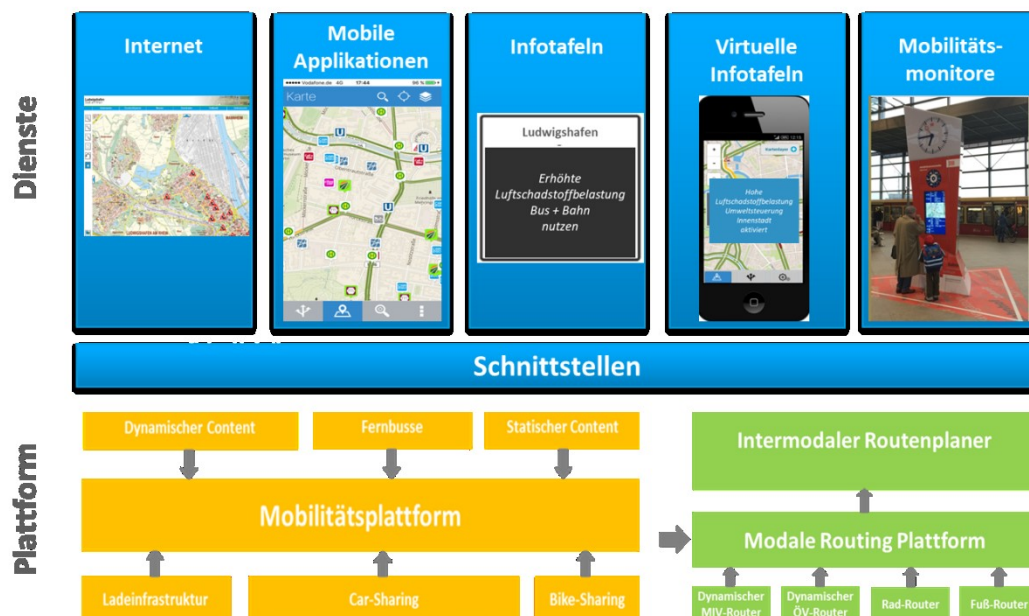
Abbildung 2 Komponenten des Informations- und Mobilitätsmanagements

Dabei wird insbesondere auch den Bedürfnissen und Anforderungen des Radverkehrs – einem wichtigen Baustein für die nachhaltige Mobilität – besser Rechnung getragen; z.B. über eine dynamische „grüne Welle“ für den Radverkehr. Ziel ist es, das NO 2 -Minderungspotenzial weiter zu erhöhen und die Verkehrsteilnehmer über ein multi- und intermodales Informations- und Mobilitätsmanagement in ihrer täglichen Mobilität zu unterstützen (vgl. Abbildung 2).