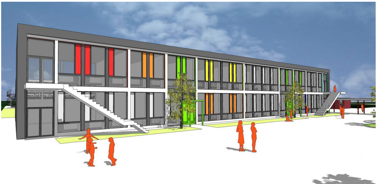
Variantenentscheidung der Ausführung