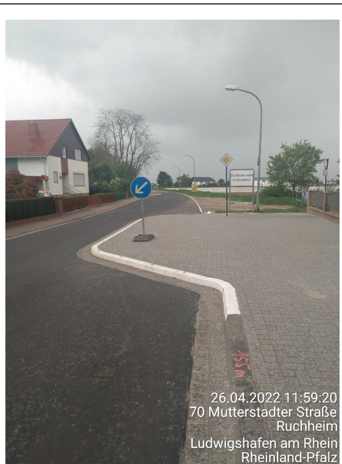
26.04.2022 11:59:20 70 Mutterstädter Straße Ruchheim Ludwigshafen am Rhein Rheinland-Pfalz