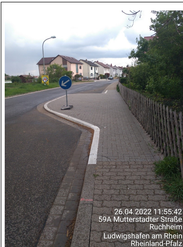
26.04.2022 11:55:42 59A Mutterstädter Straße Ruchheim Ludwigshafen am Rhein Rheinland-Pfalz