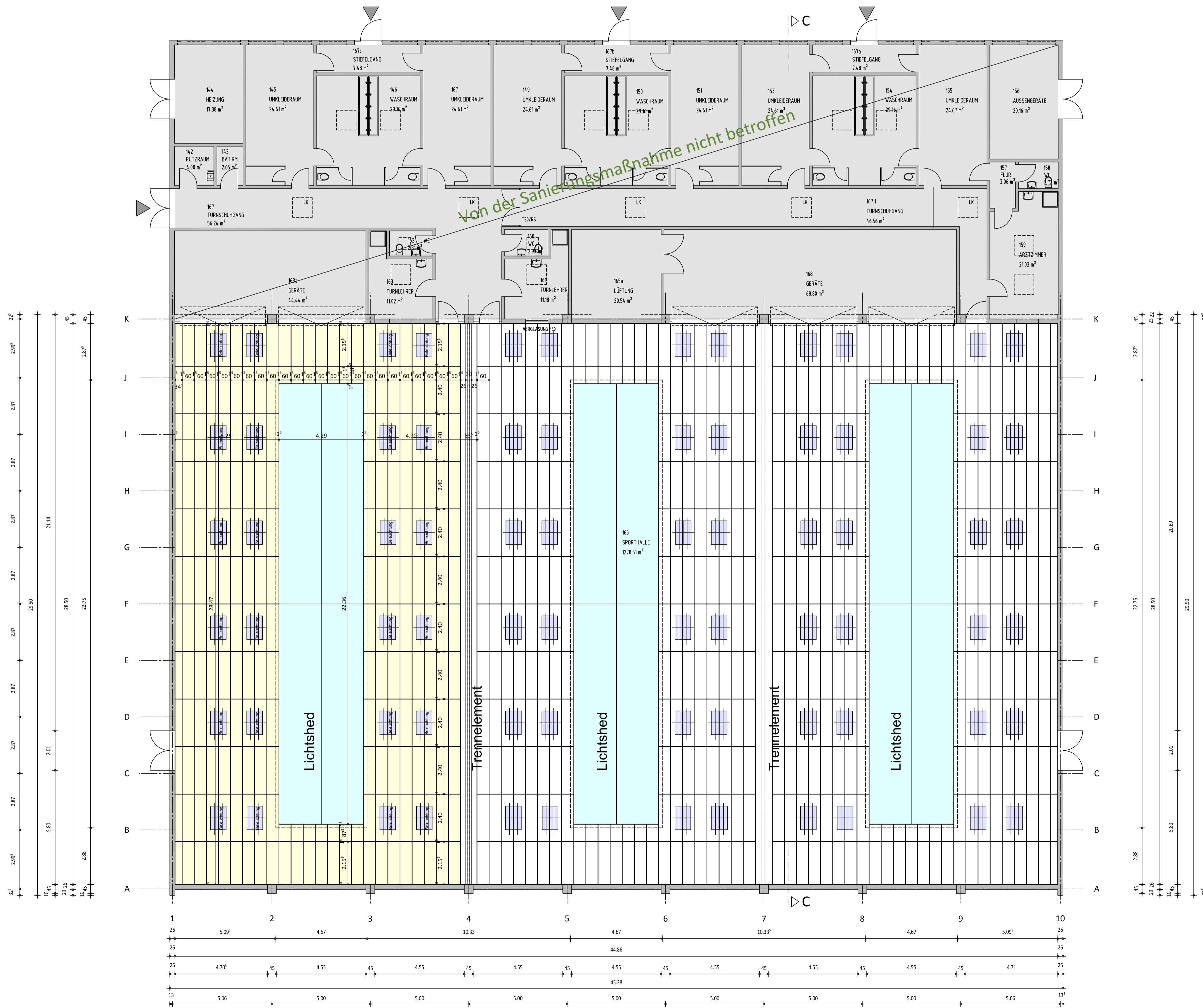
Grundriss Erdgeschoss Dreier-Sporthalle IGS Gartenstadt Deckenuntersicht