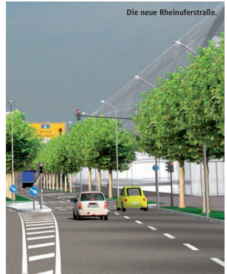
Die neue Rheinuferstraße.

ausgewiesen. So weisen an den Stadteingängen sowie am Rheingönheimer Kreuz auf der B 9 großflächige Schilder mit dem Text „Stadtumbau – Aufbruch am Rhein“ und dem Aktionslogo „heute für morgen“ auf die Verkehrserschließungsarbeiten hin. Über 70 normale Verkehrsumleitungsschilder, die ebenfalls mit dem Aktionslogo „heute für morgen“ versehen sind, weisen dann kleinräumig den Weg. Alle Informationen rund um die Umleitungsempfehlungen können unter www.ludwigshafen.de und www.heutefuermorgen.de im Internet abgerufen werden. Auch informieren Flyer über die Umleitungen und die jeweiligen Bauabschnitte. Die Flyer liegen in den Bürgerbüros sowie im Infozentrum Stadtumbau, Rathausplatz 10 und 12, aus.