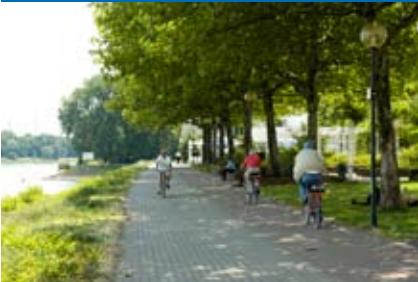
links: Radfahrer auf der Parkinsel.

Mit dem Umbau der City stemmt Ludwigshafen eines der größten und komplexesten Projekte seiner Stadtentwicklung. Viele Vorhaben greifen dabei ineinander, und es werden die verschiedensten Bereiche städtischen Lebens wie Wohnen, Arbeiten, Einkaufen, Lernen oder Ausgehen berührt. Ludwigshafen baut, plant, diskutiert, pflanzt, gestaltet, inszeniert und unternimmt noch vieles mehr. Ziel ist es, die Stärken der Stadt am Rhein weiter auszubauen. Öffentliche Hand und private Investoren, Bürgerschaft und Verwaltung handeln heute gemeinsam für morgen.