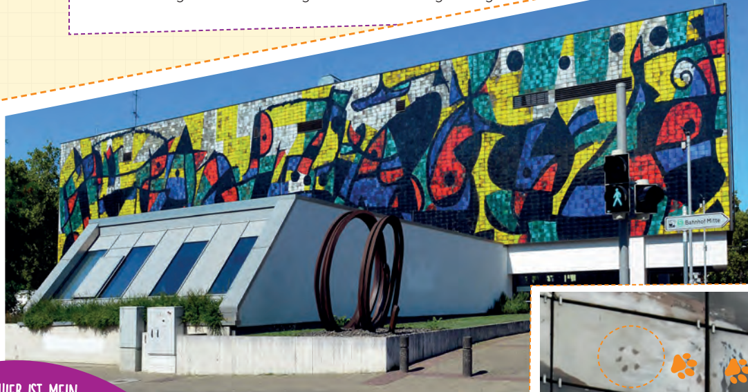
Als Wahrzeichen des Museums gilt die farbenprächtige Wand aus Keramik-Fliesen des Spaniers Joan Miró.

Weißt du, was ein Museum ist? Und kennst du schon das Wilhelm-Hack-Museum in Ludwigshafen? Mit seiner kunterbunten Fassade ist es eigentlich gar nicht zu übersehen. Ich mag es besonders gerne. Denn dort gibt es nicht nur Skulpturen und Gemälde von tollen Künstler*innen in den Räumen, sondern auch einen Garten, in dem ich mit meinen Freunden umherschwirren kann. Doch wenn du jetzt denkst, Kunst sei nur etwas für Erwachsene, dann irrst du dich. Dieser Koffer hier ist vollgepackt mit tollen Sachen, die wir gemeinsam entdecken können. Er kommt an Grundschulen und Kindergärten in Ludwigshafen und Umgebung.