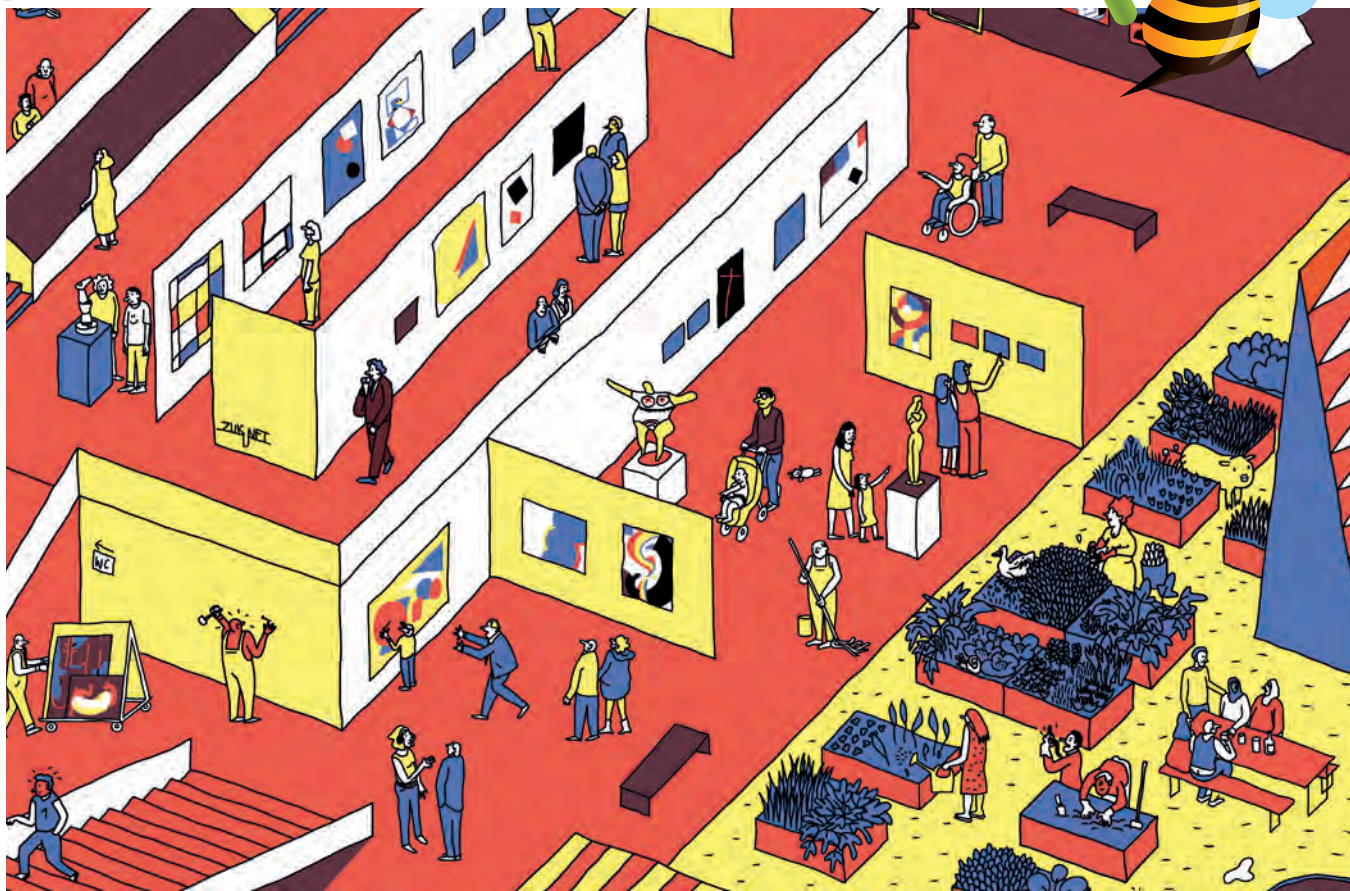
Illustration: Thomas Rustemeyer